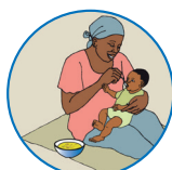
Alimentation de mon enfant