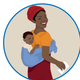
Suivi de la santé de mon enfant