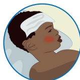
Signes de danger