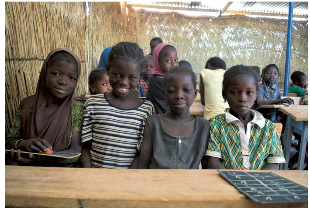
Enfants à l'école au Burkina Faso

Un troisième projet financé par le Fonds Humanitaire Régional pour l'Afrique de l'ouest et du centre a débuté en juillet 2022 pour une durée d'une année. Il vise à la fois à permettre à plus de 8'000 enfants et jeunes affectés par la crise sécuritaire d'aller à l'école et d'y avoir un accès à de l'eau salubre grâce à des forages.