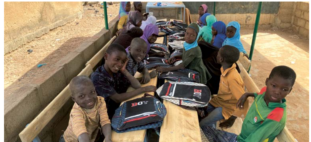
Élèves au Burkina Faso à l'école