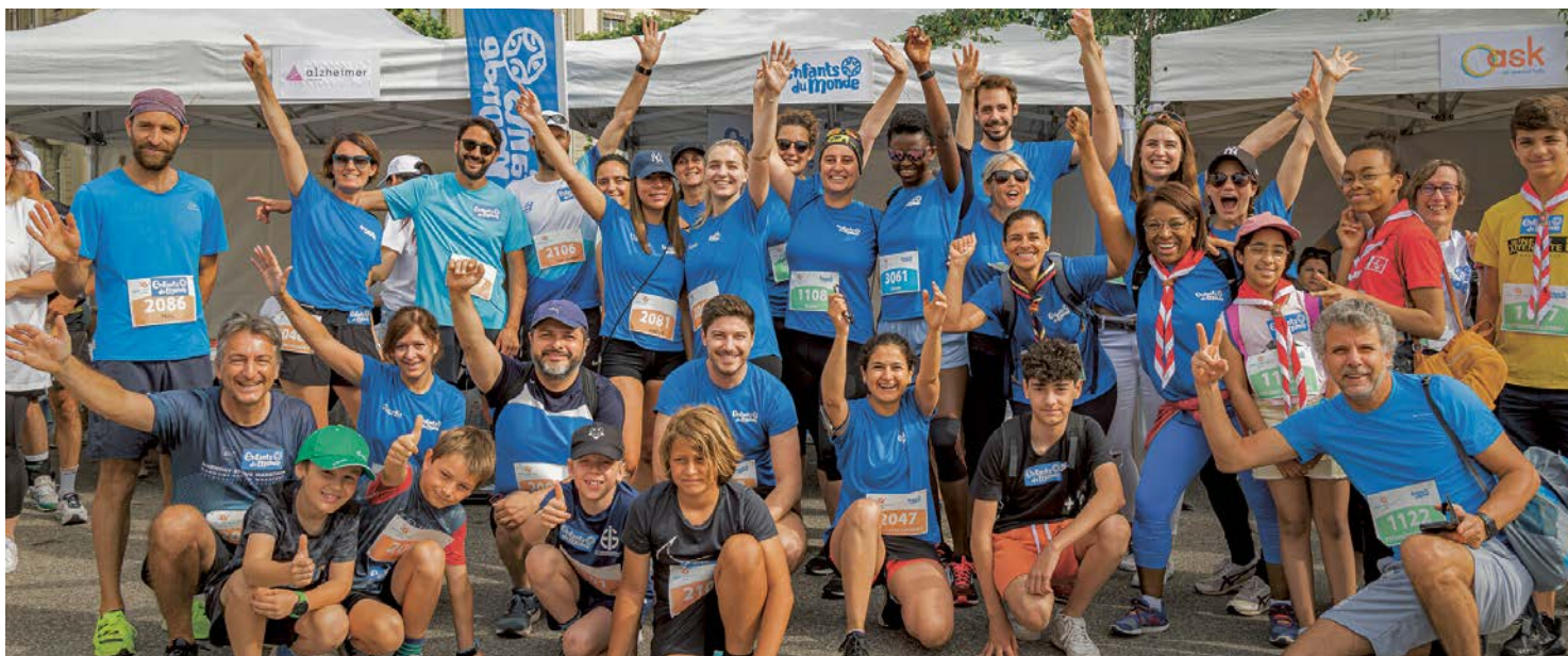
Coureurs et coureuses pour Enfants du Monde lors de Race for Gift

L'évènement a permis de récolter 4'135 CHF. Bravo pour l'imagination et l'engagement de ces jeunes du Collège Voltaire!