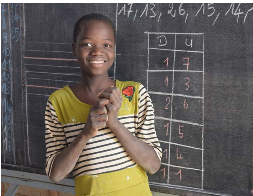
Enfants à l'école au Burkina Faso